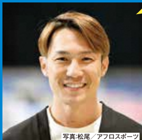
スピードスケート 加藤 条治