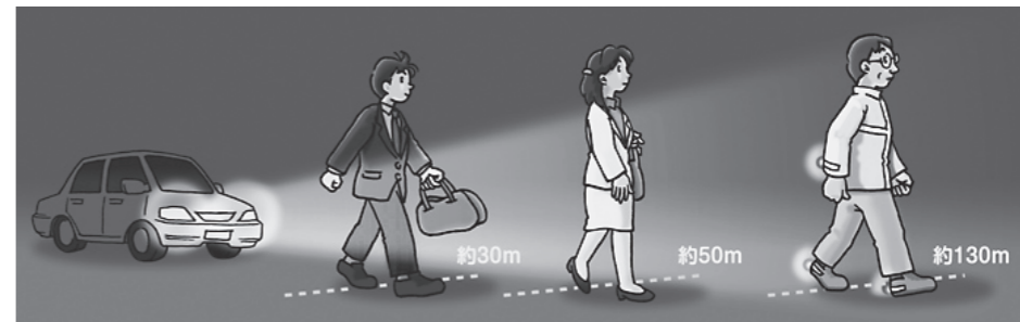
黒っぽい服装 明るい服装 反射材着用