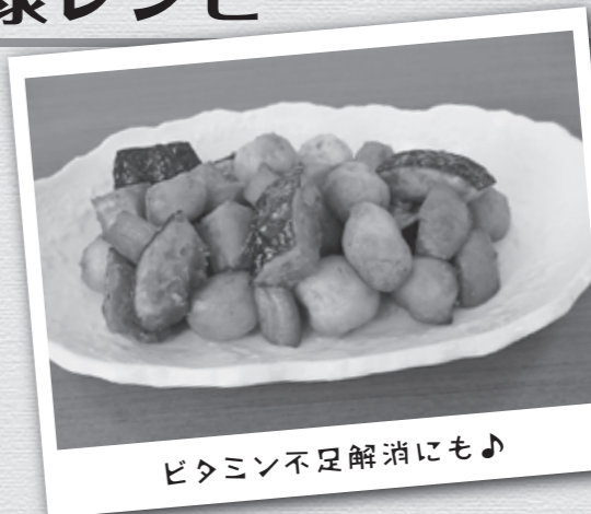
ビタミン不足解消にも♪

簡単においしくできる一品です。シンプルに素揚げすることで、野菜本来のおいしさが楽しめます。